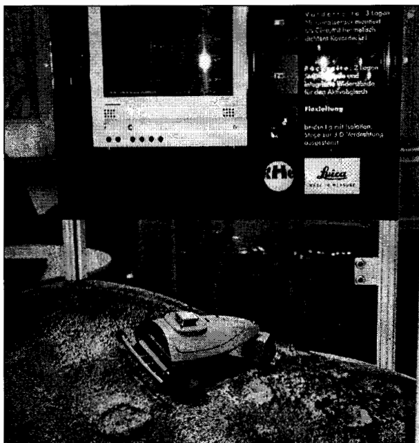
Bei Messen zeigt die Radeberger Hybridelektronik GmbH auch gerne ihren ferngesteuerten Roboter mit den hybriden Schaltkreisen. Das Besondere ist ein elektronischer Kompaß mit Neigungssensoren.