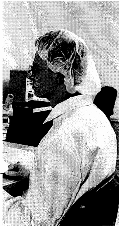
Die Mitarbeiter der Radeberger Hybridelektronik GmbH verfügen über langjährige Erfahrungen in der Entwicklung und Produktion von mikroelektronischen Baugruppen

Die nächste Besonderheit sind starke Schwankungen in der Auftragslage. Deshalb gibt es Regelungen in einer Betriebsvereinbarung über flexible Arbeitszeit und ein Jahresarbeitskonto. Wenn beispielsweise, wie im vergangenen Jahr, ein Riesenboom in der Nachrichtentechnik und Telekommunikation auftritt, kann darauf kurzfristig reagiert werden. „Unsere Mitarbeiter sind sehr motiviert. Ihre Hohe Flexibilität und die notwendigen Fachkenntnisse bilden die Grundlage für unsere erfolgreiche Entwicklung“, so der Geschäftsführer.